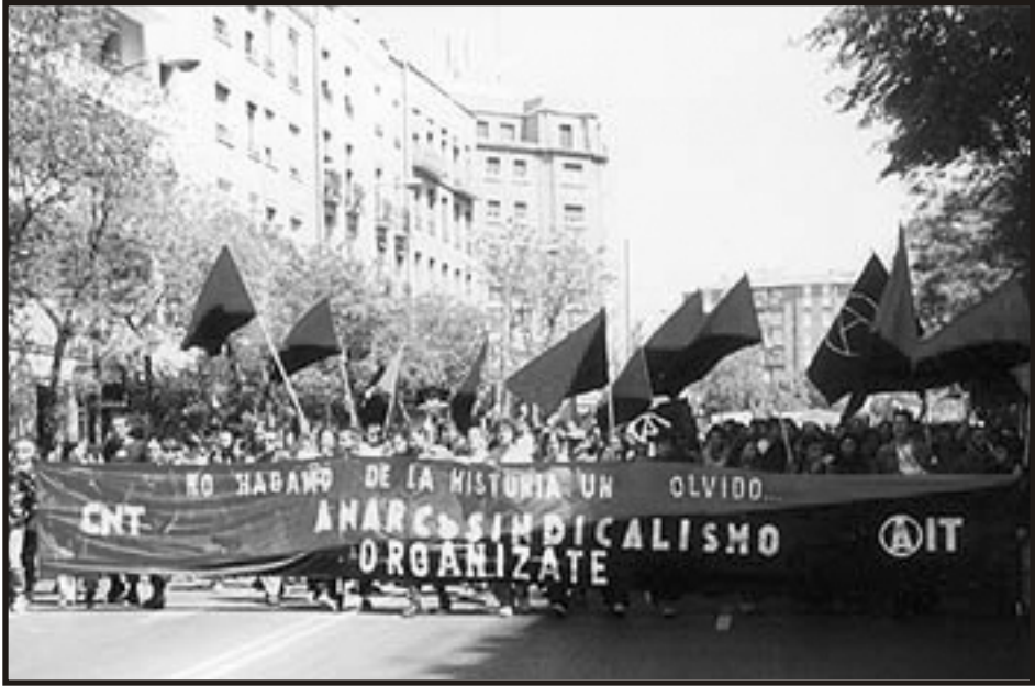
VIŠE OD 15,000. ANARHISTA/KINJA JE POKAZALO SVOJ PROTEST PROTIV KAPITALIZMA I DRŽAVE TOKOM GENERALNOG ŠTRAJKA U ŠPANIJI 20. JUNA