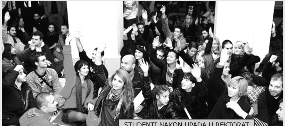
STUDENTI NAKON UPADA U REKTORAT

Kada je Filološki fakultet ipak blokirao, vlast je upotrebila širok arsenal manipulacija kako bi izolovala studente i potom razbila blokadu. Tokom blokade, mediji su svakodnevno objavljivali dezinformacije da su ispunjeni svi zahtevi i da je blokada prekinuta kako bi se unela zabuna i smanjio broj studenata koji će doći na blokadu. Pokušavali su da javnost