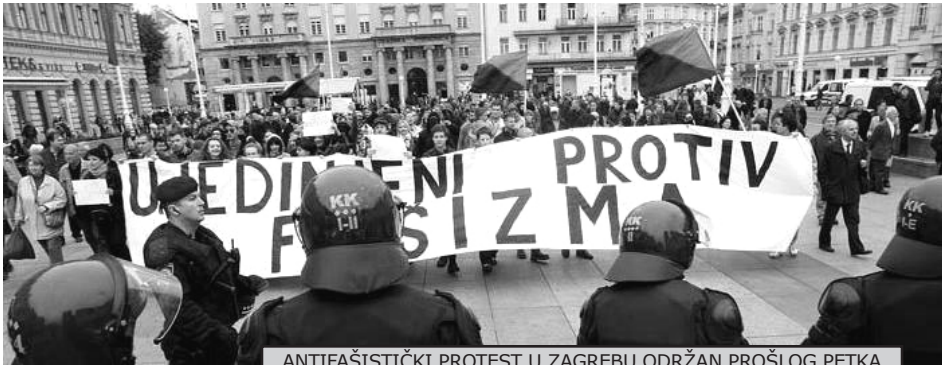
ANTIFAŠISTIČKI PROTEST U ZAGREBU ODRŽAN PROŠLOG PETKA

O fašistima najčešće razmišljamo kao o nečovečnim zločincima, krvolocima koji ne biraju kako i koga ubijaju. Ali oni su mnogo više od toga.