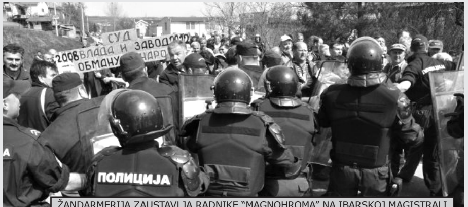
ŽANDARMERIJA ZAUSTAVLJA RADNIKE "MAGNOHROMA" NA IBARSKOJ MAGISTRALI

Prošlog leta policija je sprečila zaposlene iz pet preduzeća za puteve, iz „Nibens grupe“, da uđu na svoja radna mesta. Sve što su radnici tražili je novac koji su već zaradili i da im se obezbedi da normalno rade. Žandarmerija je u više gradova sprečila putare da blokiraju saobraćaj, a na jugu su jake policijske snage opkolile sve pogone i punktove firme PZP u Nišu, Dolcu, Pirotu i Prokuplju i nisu dozvolili radnicima da izađu iz kruga pogona. U noćnoj akciji rasterani su radnici „Bačkaputa“, koji su bili na traci Koridora 10 kod Vrbasa, a kada su se dve nedelje nakon toga, uprkos tome što su pet meseci bez plate, vratili na posao, policija je počela da traži imena lica koja su tokom protesta blokirala autoput. Kada su, takođe prošlog leta, bivši radnici „TK Raška“, nekadašnjeg tekstilnog giganta, nakon 15 dana sedenja na stepenicama Gradske