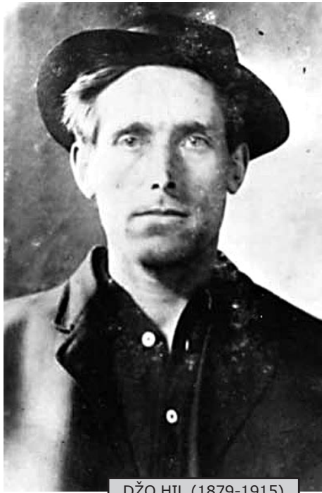
DŽO HIL (1879-1915)