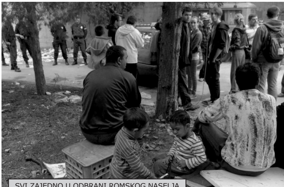
SVI ZAJEDNO U ODBRANI ROMSKOG NASELJA

Policija i sudski izvršitelji koji su 17. septembra došli sa namerom da iseles Rome otišli su iz Zemunske ulice neobavljena posla. Sudske izvršitelje dočekalo je stotinak ljudi, Roma i njihovih komšija, koji su sprečili da 23 porodice budu izbačene na ulicu i da bez krova nad glavom dočekaju jesenje kiše i hladnoću.