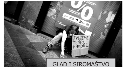
GLAD I SIROMAŠTVO NA ULICAMA ŠPANIJE

Prema najnovijim pokazateljima, nezaposlenost u Španiji je pogodila gotovo četvrtinu stanovništva. Postotak nezaposlenih među stanovnicima Španije je sa 24,6 odsto (tj. 5,69 miliona stanovnika) u drugom tromesečju dosegao 25% (5,78 miliona stanovnika) u trećem tromesečju, što je rekordan broj još od Frankovog diktatorskog režima 70-ih godina prošlog veka. Nezaposlenost među mladima, tj. onima između 16 i 24 godine, iznosi 52 posto. Najteža situacija je u južnom delu Španije gde jedan od tri stanovnika ne može da pronađe posao. Ekonomski rast daleko je slabiji od očekivanog, a u kombinaciji s merama štednje može se očekivati da će broj nezaposlenih u 2013. godini dodatno porasti. Kako bi namirile deficit, španske vlasti su u poslednje dve godine donele niz mera štednje, koje su uključivale povećanje PDV-a, samnjivanje zaposlenih u zdravstvu i školstvu, promene u penzionisanju (sa 65 na 67 godina), pooštavanje uslova za beneficije nezaposlenima i dr. Ove mere izazvale su otpor španskog stanovništva.