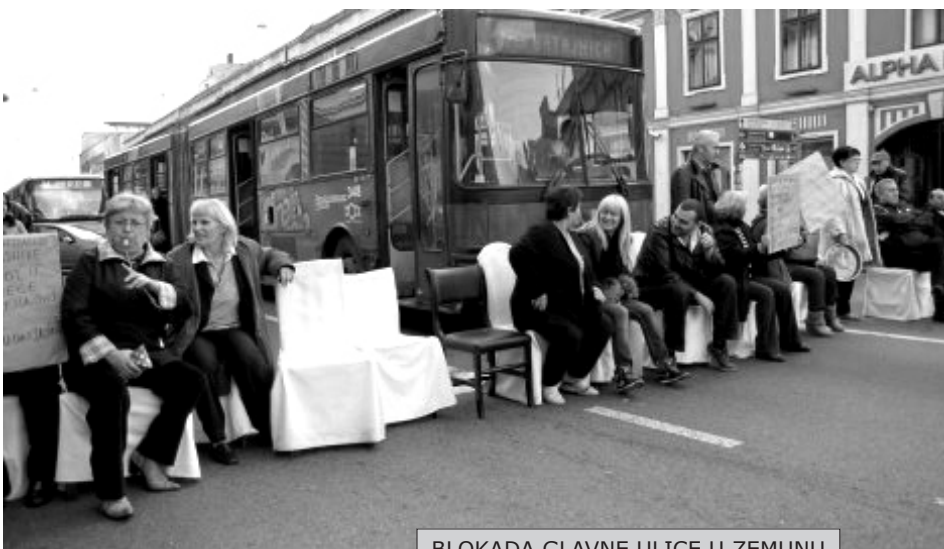
BLOKADA GLAVNE ULICE U ZEMUNU

Radnici ugostiteljskog preduzeća „Central“ blokirali su 30. oktobra Glavnu ulicu u Zemunu, jer više od 15 meseci nisu primili plate i jer niko od političara ne želi da peši njihov problem koji traje pet godina. Oni su izneli stolice na kolovoz u Glavnoj ulici u Zemunu, čime su izazvali blokadu