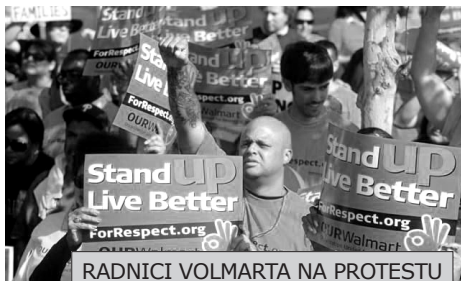
RADNICI VOLMARTA NA PROTESTU ODRŽANOM U SEPTEMBRU

Grupe „Naš Volmart” i „Stvaramo promene” izjavljuju da su njihovi pripadnici u oko 1000 prodavnica širom SAD-a spremni da štrajkuju na Crni petak. Predviđa se da bi čak i mali broj učesnika u štrajku mogao imati efekat jer bi kampanja ispred radnji mogla značajno da obeshrabri kupce i nanese štetu „Volmartu”.